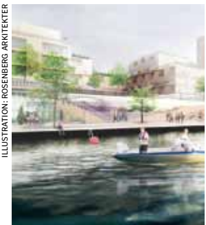
ILLUSTRATION: ROSENBERG ARKITEKTER

I dagsläget finns det omkring 1 700 kommunala förskoleplatser och drygt 1 500 stycken inom den privata verksamheten.